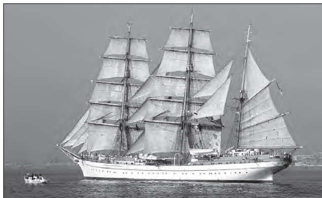
Прямі вітрила барка «Товариш», п. Херсон

Мені не траплялися згадки, чи могли вони поєднувати веслування й вітрило одночасно, але тепер на гребно-парусних шлюпках це вважають моветоном, і так роблять тільки салаги: щось одне. Йдуть або НА веслах, або ПІД парусом. Думаю, це такий самий давній звичай, як грецьке слово «парус», котре ми успадкували безпосередньо від винахідників цієї технології, яку приписують легендарному Дедалові. Перед винайденням дельтаплана він намагався втекти з Криту під вітрилами. Ну, воно й логічно: хтось має вибирати усі ті браси, шкоти й фали замість навалюватися на весла. А в ходовий вітер весла лише гальмують і «ловлять лящів» на хвилях. Утім, останній вираз, найімовірніше, вже наш, дніпровський. Бо в морі лящів нема. Повертаючись до теми вітрил – на руських лодях і запорозьких чайках вони теж були прямі.