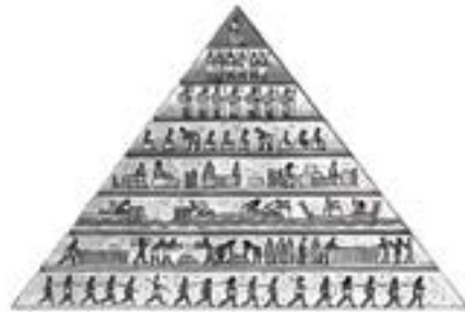
розшарування суспільства на класи

У римському сприйнятті варварами стали передусім народи, що жили на просторах Європи: кельти, германці, слов'яни. Найбільше вплинули на подальшу долю Західної Римської імперії германці.