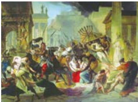
Взяття Рима Гейзеріхом

Рим після декількох невдалих спроб підкорити світ варварів відгородився від нього лімесом — укріпленою лінією на кордонах, що складалася з ровів, башт, воєнних таборів. Але кордон не роз'єднав два світи, а скоріше поєднав їх. У прикордонних містах процвітала торгівля, усе більше германців ішли служити до римського війська, германська знать переймала деякі манери й звичаї римлян, відправляла своїх дітей навчатися античної мудрості.