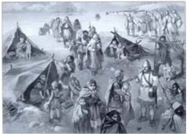
Поселення германців під час переселення

Найважливіші питання життя племені вирішувалися на народних зборах. Старійшини і вождь обговорювали і приймали найважливіші рішення, які потім схвалювалися на зборах. Деякі питання вони вирішували, навіть не радячись з усім племенем. Вождя і старійшин називали знаттю, оскільки вони користувалися владою, авторитетом і повагою. Як правило, плем'я обирало вождем сміливого, мудрого й досвідченого воїна. Але починаючи від IV–VI ст. влада вождів у деяких племен поступово стає спадковою.