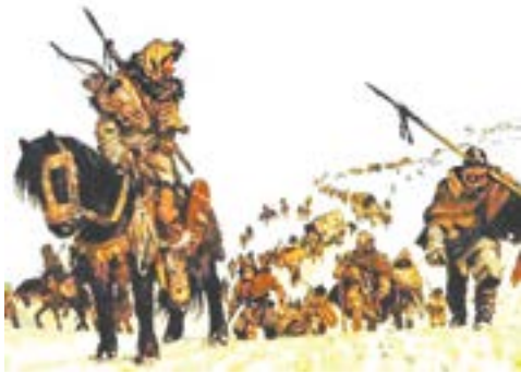
Велике переселення народів