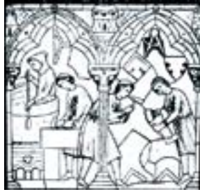
відділення ремесла від землеробства